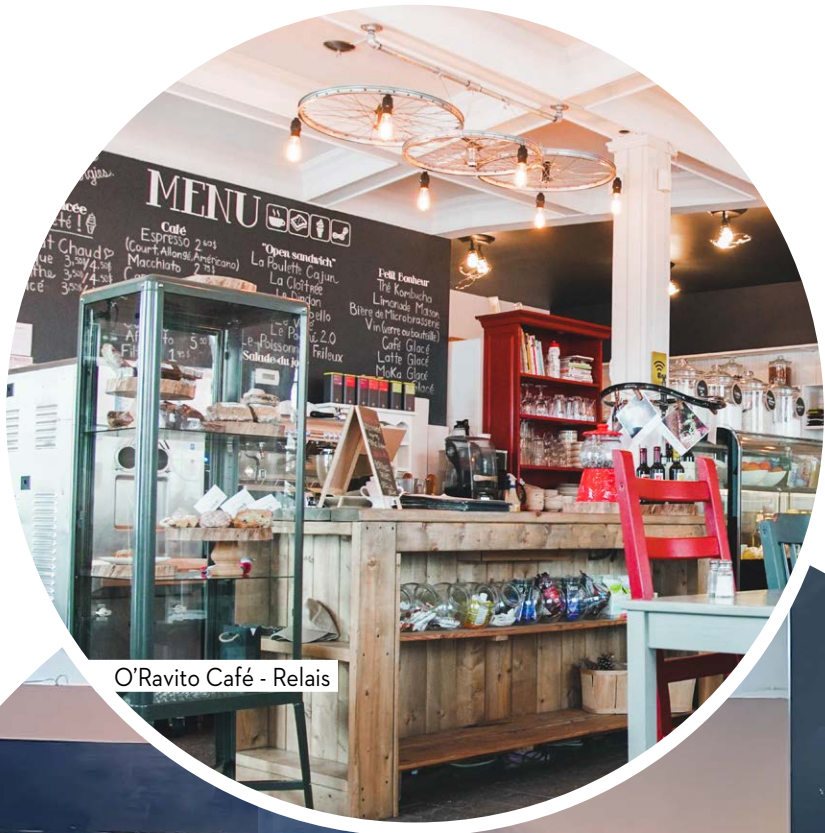
O'Ravito Café - Relais