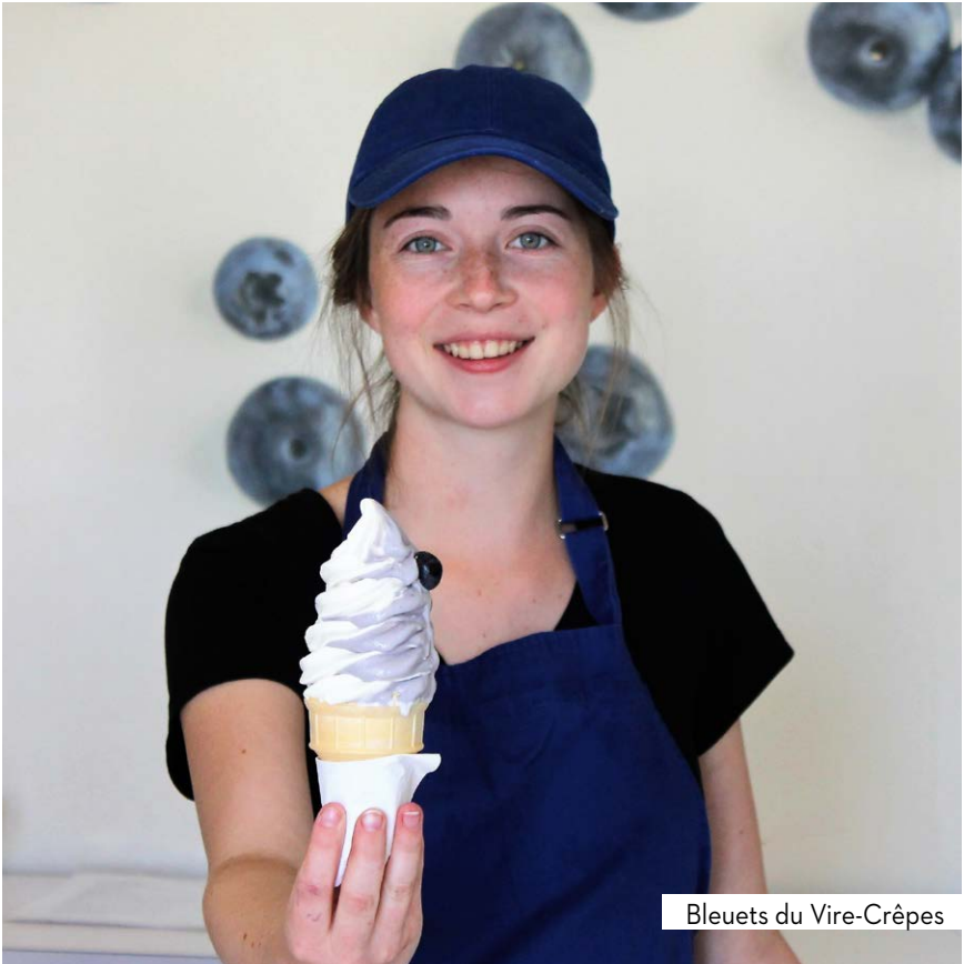
Bleuets du Vire-Crêpes