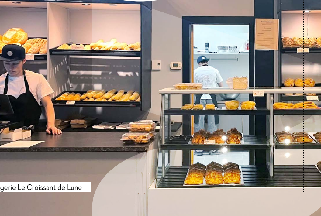
agerie Le Croissant de Lune